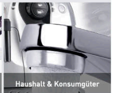
Haushalt & Konsumgüter